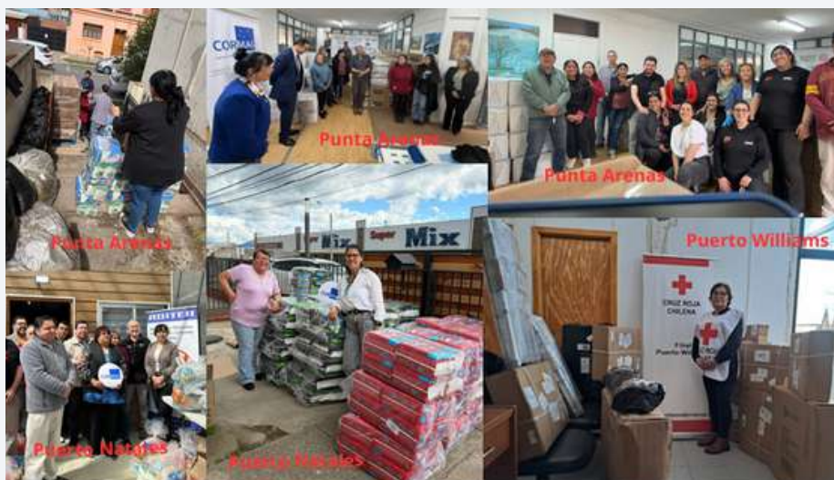
Cobertura territorial iniciativa social de apoyo a red organizaciones de voluntarios de la Region de Magallanes y de la Antartica Chilena